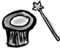
Wizard of Oz